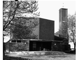
Kirche St. Albertus Magnus

der kath. Gemeinde St. Mariae Rosenkranz Mülheim an der Ruhr - Styrum (Pfarrei St. Barbara)